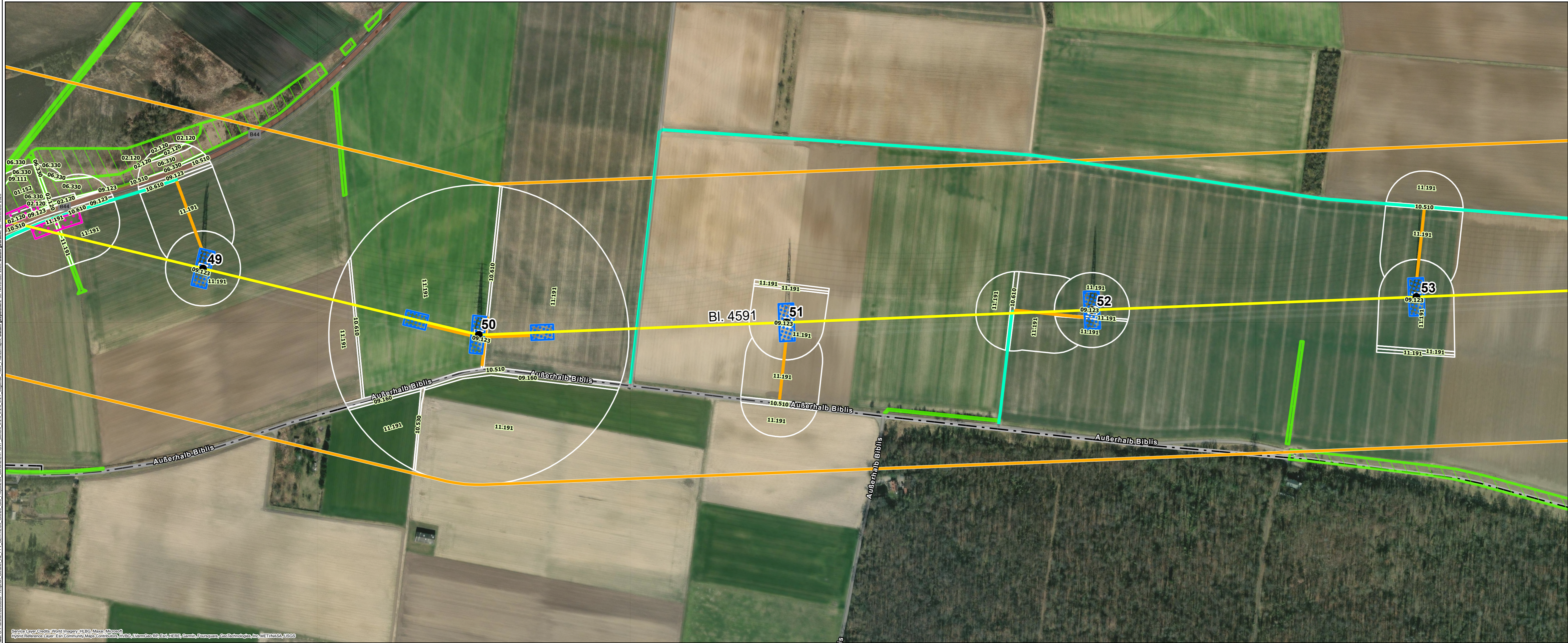
Foto: © Frankfurt0088866 - Amprion / Birnnet A2_PVY_GER_R099_CIES00_GIS_Projekte04_BerichteUV/UVAP_Bericht_5.2.6_5.2.7_Legende_Tiere_Pflanzen und die biologische Vielfalt - November 2023, Datum gedruckt: 30. November 2023, Datum geladener: 30. November 2023, Legende Tiere Pflanzen und die biologische Vielfalt - November 2023

Legende siehe 5.2.5, 5.2.6 und 5.2.7 Tiere, Pflanzen und die biologische Vielfalt - Legende